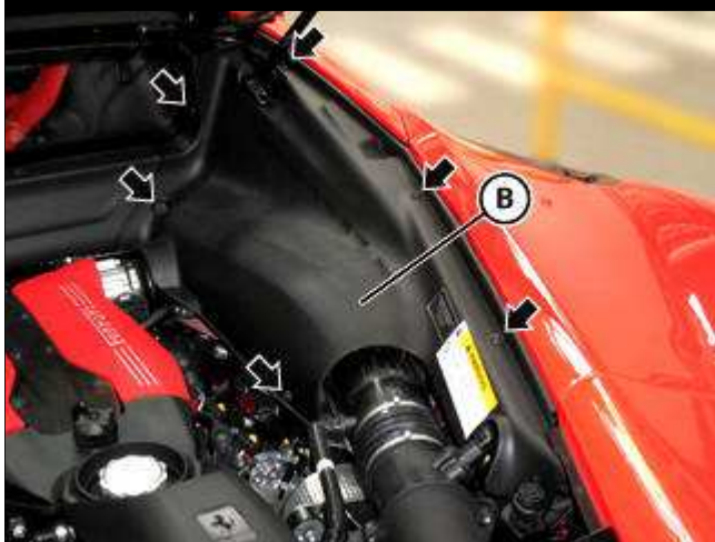
右侧侧面装饰护罩